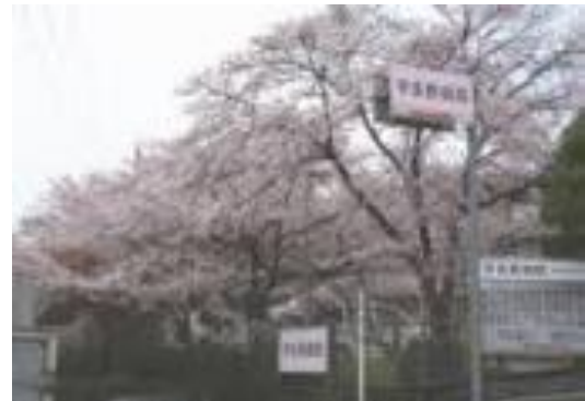
「宇多野病院のさくら」